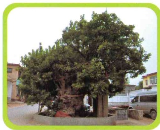
东昌府区郑家镇五圣村一级古槐